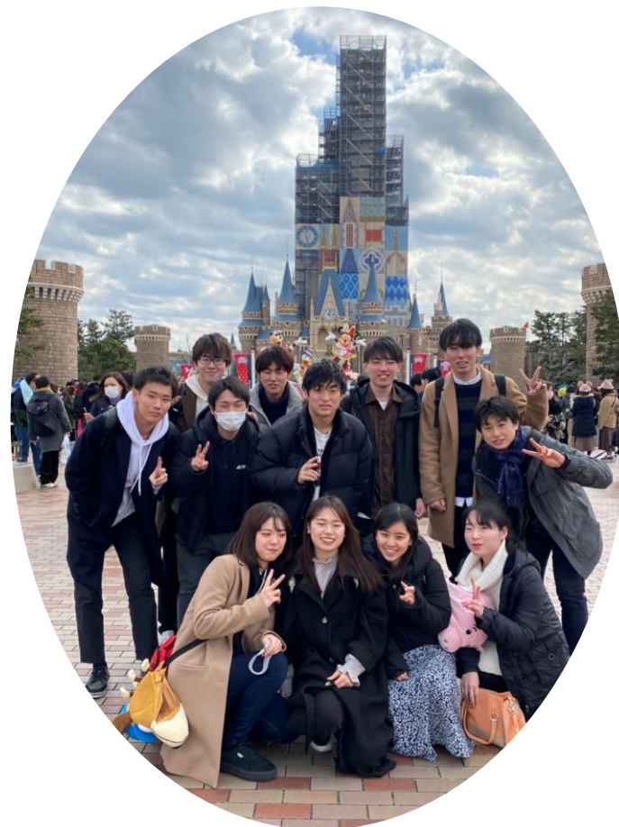
2年生で同期ディズニー